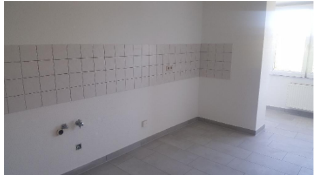
Küche mit Erker